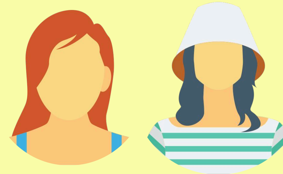
Estudiantes de Diseño Industrial UIS