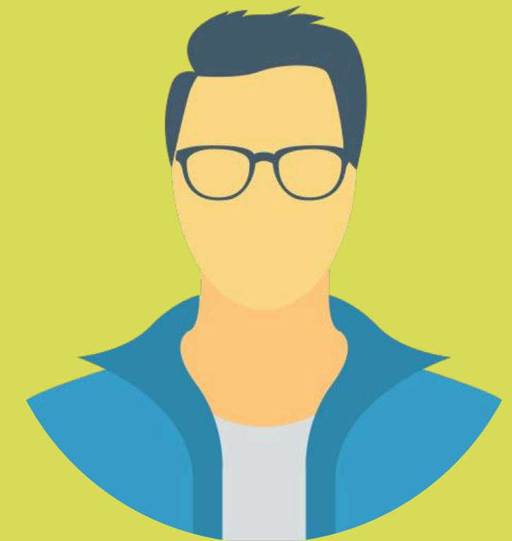
Docente de Historia del Diseño EDI UIS